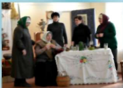
Театральный коллектив «Ярмарка» МУ ЦРК