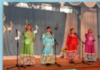
Вокальная группа «Горячие сердца» Ильинского СДК