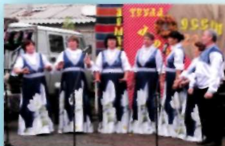
Вокальная группа «Гармония» МУ ЦРК