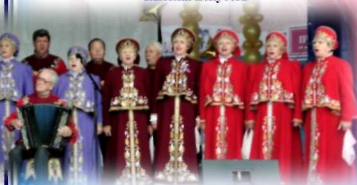
народного хора русской песни Ильинского ДК.