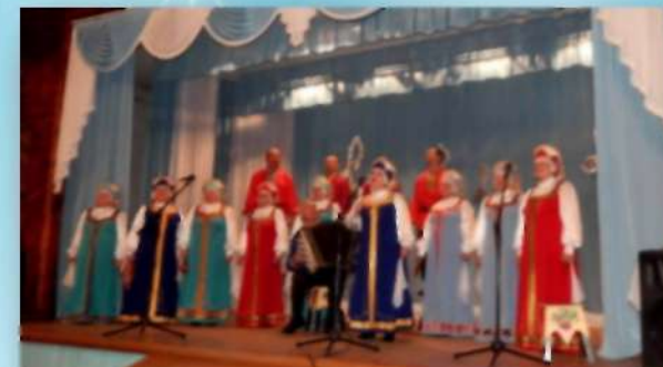
Народный хор «Калинушка» МУ ДК «Лучезар»