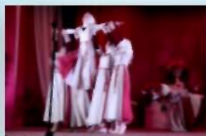
Народный коллектив ансамбль танца «Юность» МУ ЦРК