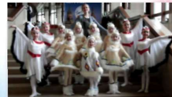
Катайский район 2017 год