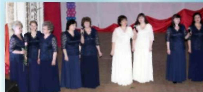
Народный коллектив «Россияночка» МУ ДК «Лучезар»