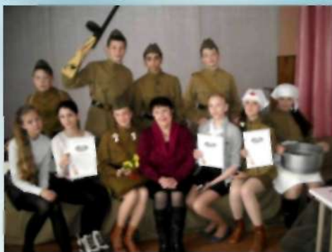
Детский театральный коллектив «Звездочки» Отдела культуры