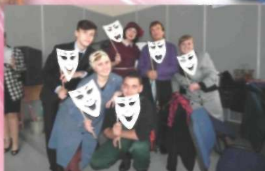
Народный коллектив агит-театра «Степан» МУ ДК «Лучезар»