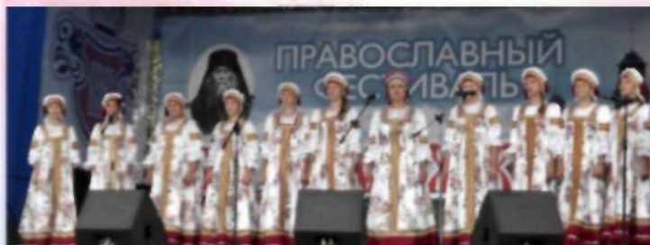
Образцовый ансамбль народной песни «Радуница» Школы искусств