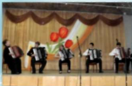
Ансамбль аккордеонистов «Искорки» Школы искусств