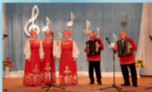
Народный коллектив «Родники» Боровского СДК