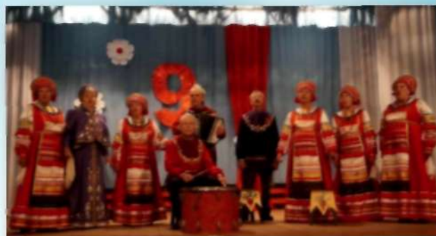
Фольклорный коллектив «Сударушки» Ильинского СДК