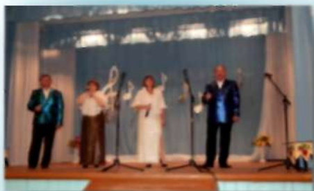
Вокальная группа «Беседа» МУ «КДО Петроавловского сельсовета»