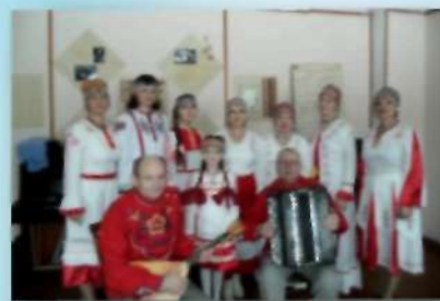
Фольклорный чувашский коллектив «Щещель» Боровского СДК