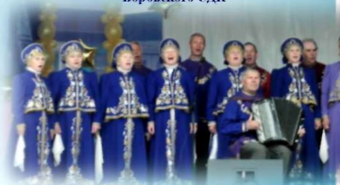
«Заслуженный коллектив Курганской области»